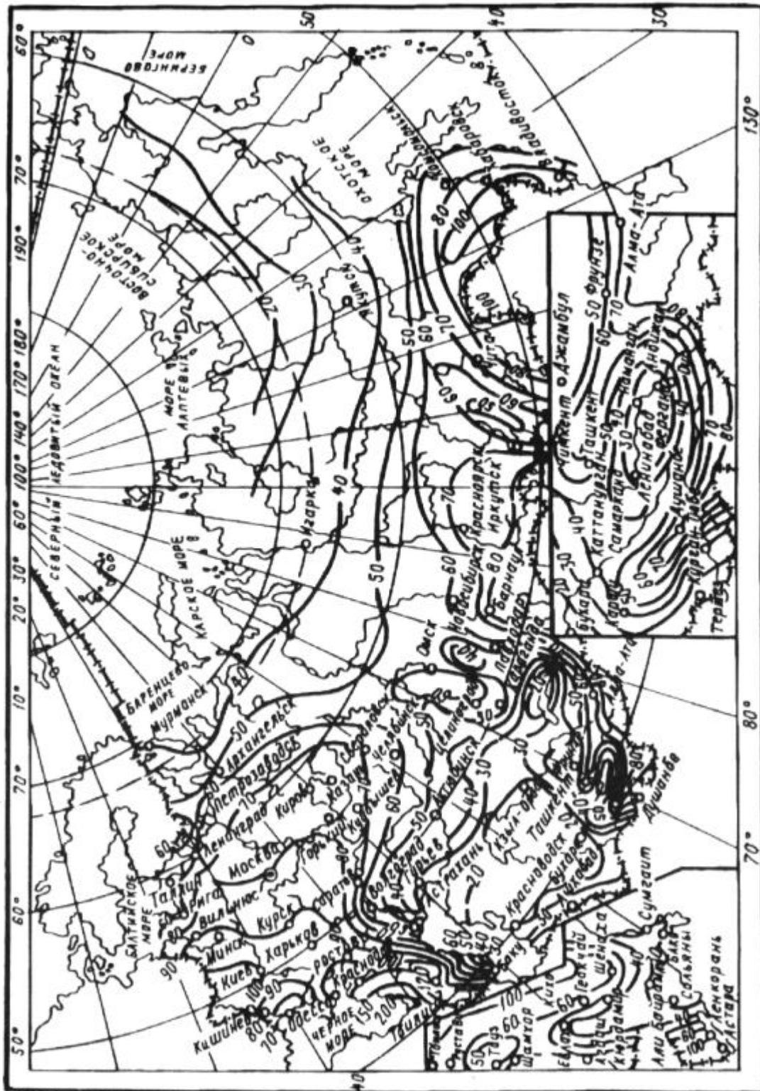
Чертеж 1. Значения величин интенсивности дождя 420