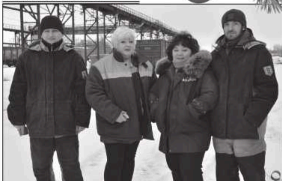
Коллектив участка разделки стального лома УЖиАТ.