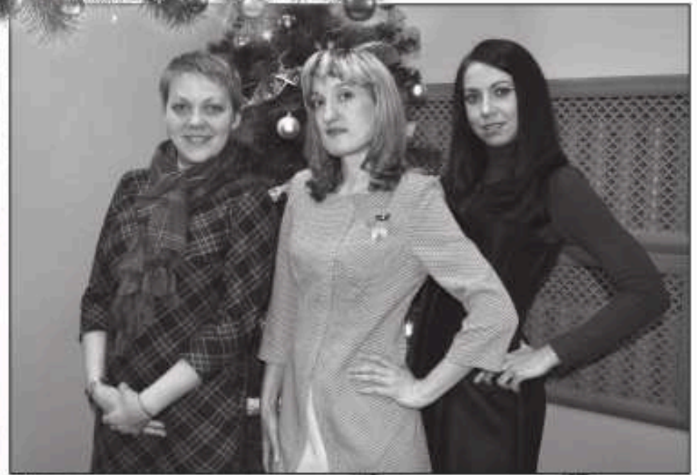
Коллектив отдела кадров дирекции по персоналу.