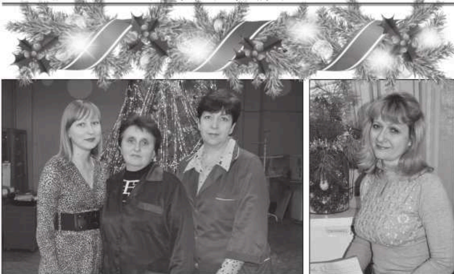
Вот такие прекрасные женщины работают в центральной заводской лаборатории дирекции по новым технологиям.