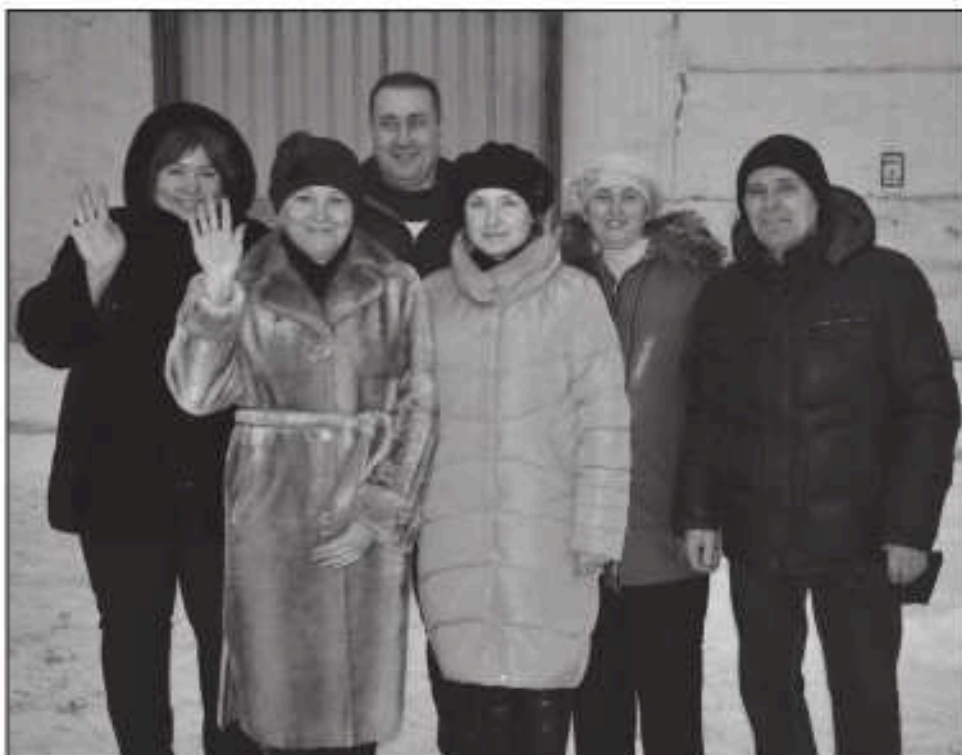
Коллектив складского хозяйства.