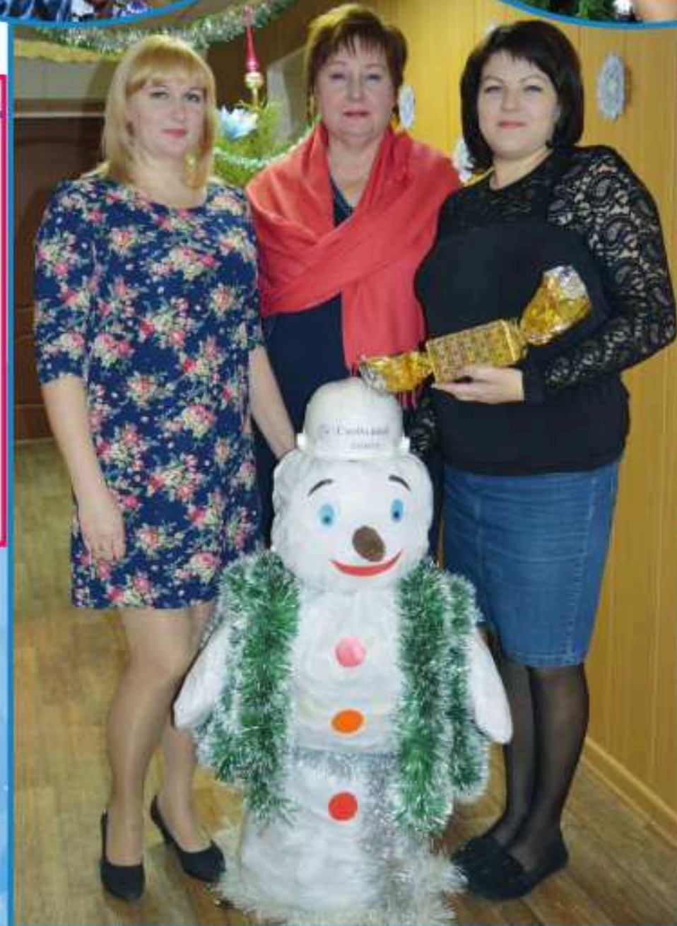
Коллектив канцелярии и замечательный символ Нового года, который появился благодаря фантазии и мастерству ее работниц.

Так пусть же сбудутся заветные желанья, И ровно в полночь чудо в каждый дом войдет, Пусть все надежды ваши и мечтанья Судьба исполнит в этот Новый год!