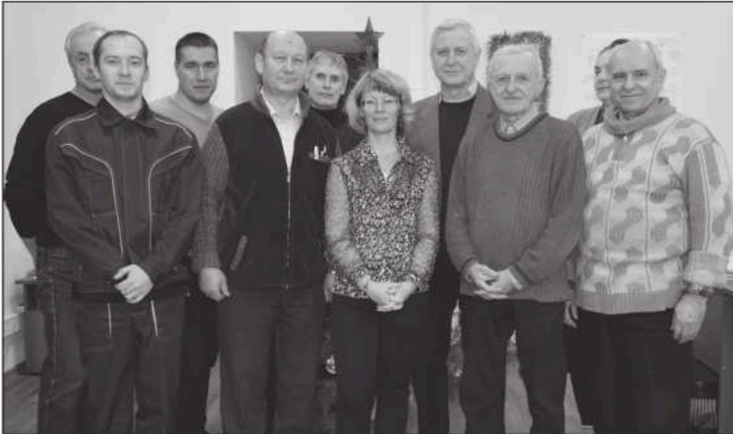
Коллектив отдела главного технолога и центра сертификации и аудита дирекции по новым технологиям.