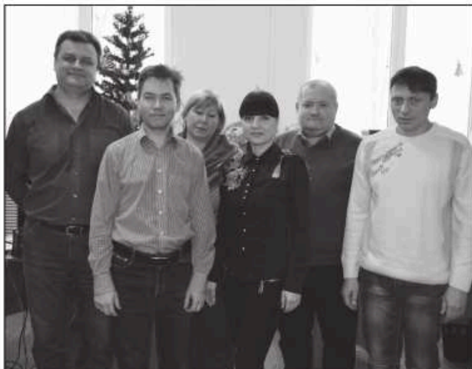
Коллектив отдела материально-технического снабжения.