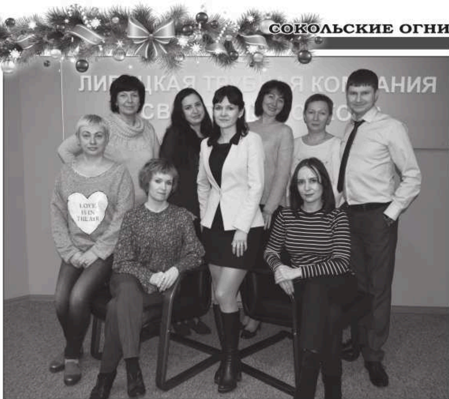
Коллектив департамента логистики и отгрузки.

1. Сокращение складских остатков трубной продукции на 32 % за счет оптимального и грамотного планирования производства продукции, а также проведенной трудовом-