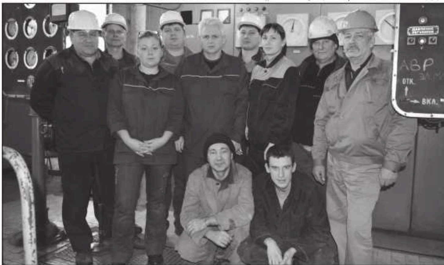
Коллектив ТЭЦ-ПВС отдела главного энергетика.

От лица ОГЭ поздравляем весь коллектив предприятия с наступающим Новым годом! Желаем здоровья, семейного благополучия и приятных событий в Новом 2017-м!