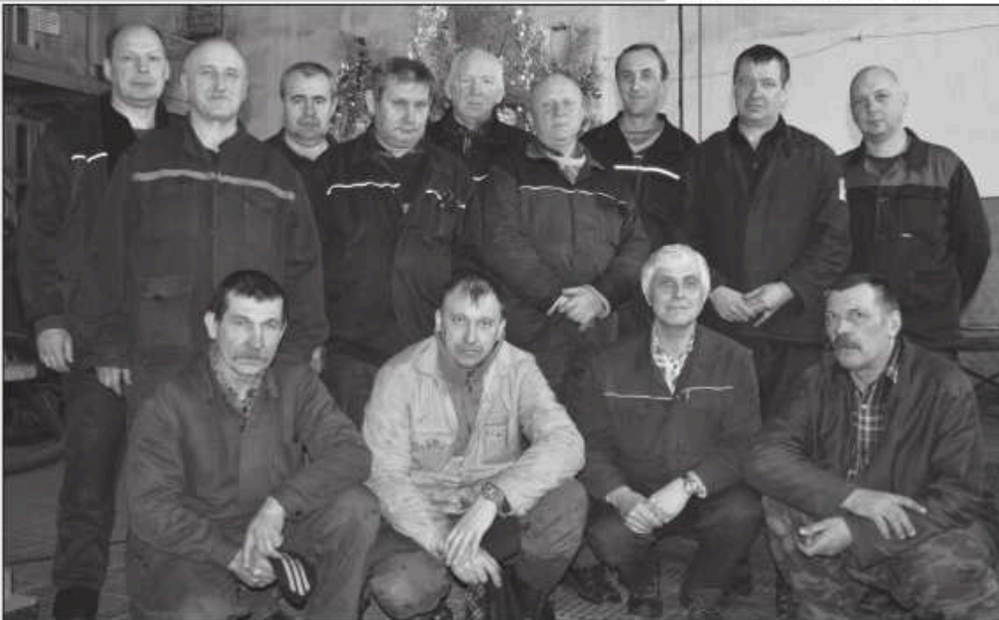
Коллектив энергоцеха отдела главного энергетика.

Еще одно важнейшее подразделение ОГЭ - это ТЭЦ-ПВС. Вся ее работа направлена на подготовку и прохождение отопительного осенне-зимнего периода.