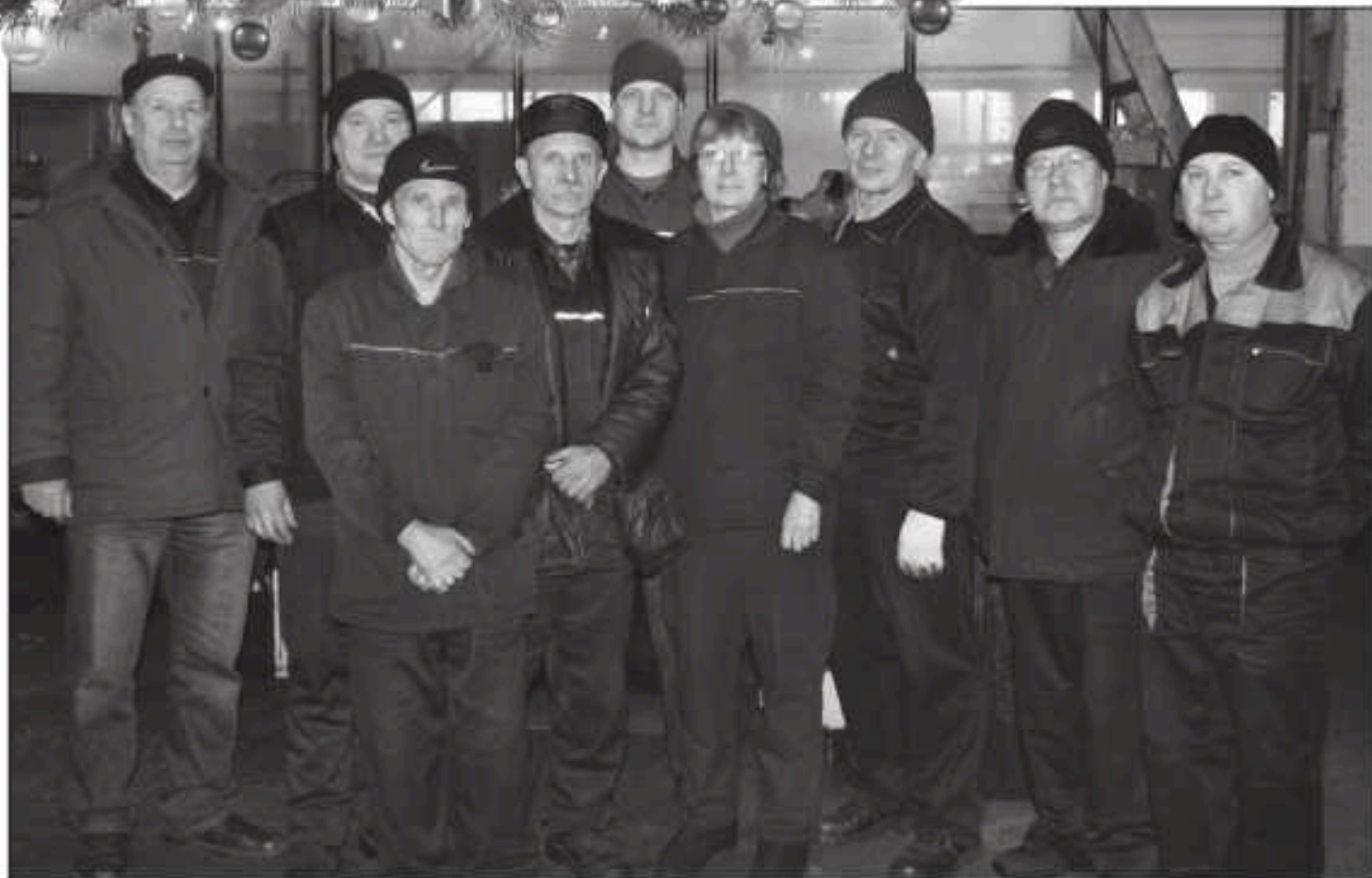
Коллектив отделения механической обработки службы по ремонту металлоформ, обработке фасонных частей и технологической оснастки ЦРО и О.